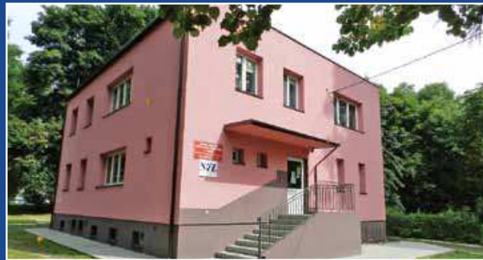
Budynek GPZO we Wrzeszczewicach po termomodernizacji

W ramach zadania w budynku świetlicy wiejskiej we Wrzeszczewicach wykonano przebudowę wewnętrznej instalacji wodociągowej i kanalizacji sanitarnej oraz budowę zewnętrznej instalacji kanalizacji sanitarnej i zbiornika