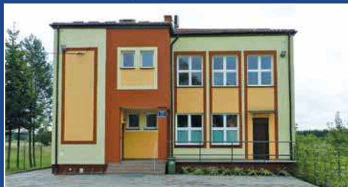
Dom Ludowy w Kopyści