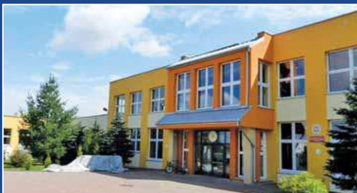
Budynek Szkoły Podstawowej nr 5 po termomodernizacji