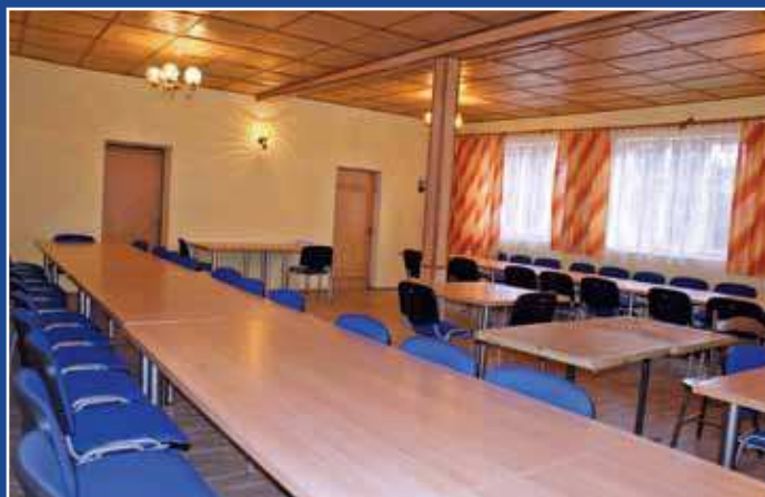
Wnętrze zmodernizowanej Świetlicy Wiejskiej we Wrzeszczewicach