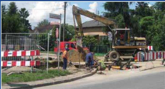
Budowa sieci wodociągowej w ul. Batorego