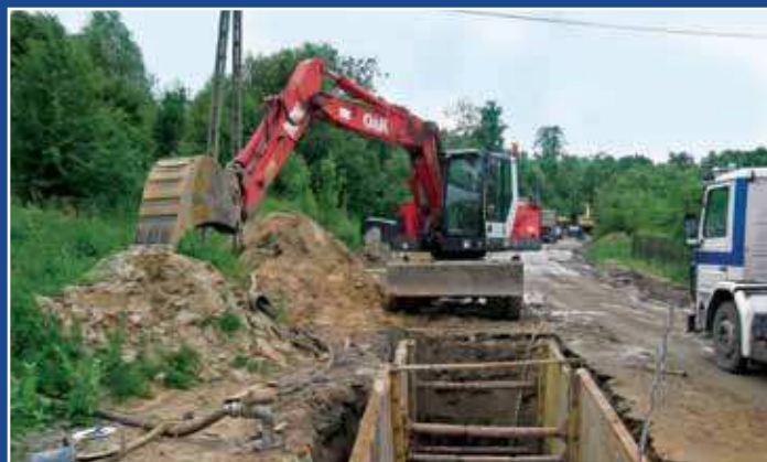
Budowa sieci kanalizacyjnej