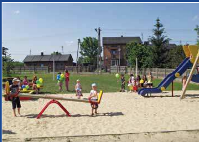
Plac zabaw przy Domu Ludowym w Orchowie