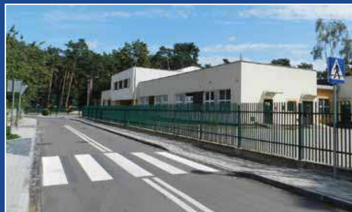
Budynek Przedszkola Publicznego nr 4