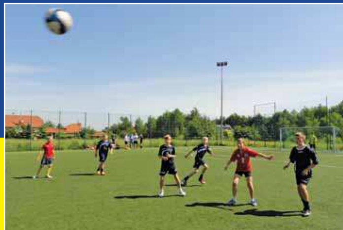
Boisko Orlik przy Szkole Podstawowej nr 5