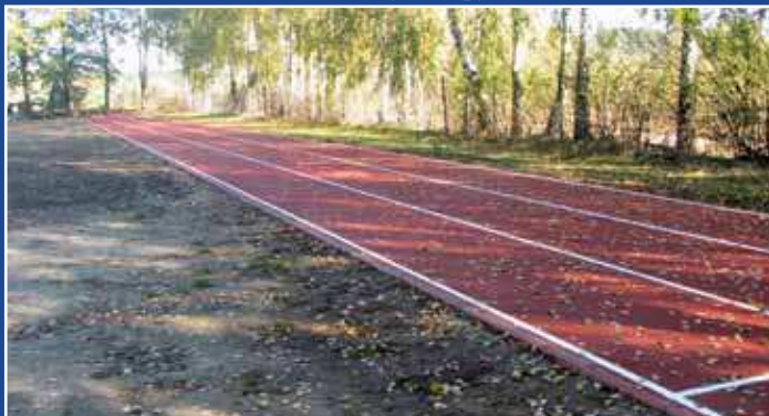
Bieżnia w Teodorach