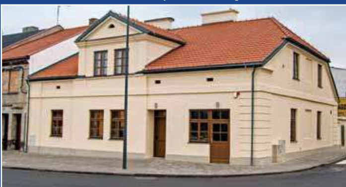
Zrewitalizowana kamienica przy Placu 11 Listopada nr 7