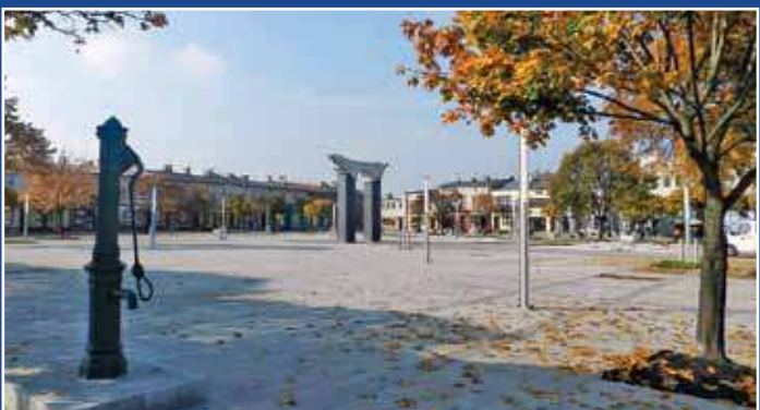
Zrewitalizowany Plac 11 Listopada