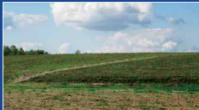
Zrehabilitowany teren składowiska odpadów w Orchowie